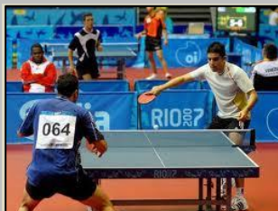
TÉNIS DE MESA

2ªfeira, 16h00/16h50 4ªfeira, 10h00/10h50 11h00/11h50