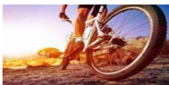
DE SOB RODAS

2ªfeira, 11h00/11h50 5ªfeira, 11h00/11h50 5ªfeira, 12h00/12h50